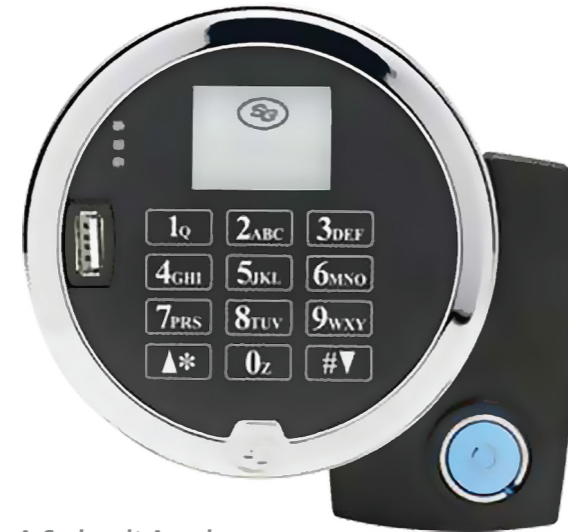
A-Serie mit Anzeige

Schlösser der A-Serie speichern die Zeit, nicht den Schlüssel. Auf diese Weise wird sichergestellt, dass die Schlösser der A-Serie nicht anfällig ist für Zeitdrift, eine wichtige Funktion, durch die die Protokollpfade der A-Serie genau und zuverlässig bleiben.