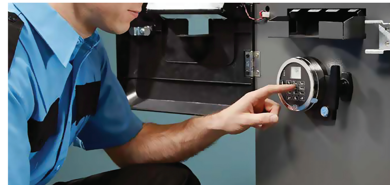
Eine schnellere, leichtere und intuitivere Lösung für die Sicherheit von Bankautomaten.

Mehrere optische Elemente, einschließlich extra großer Bildschirm und Tastaturbeleuchtung, zusammen mit Signaltönen, die jedes Schloss der A-Serie verwendet werden, verbessern die Möglichkeit des Benutzers, Informationen zu verstehen, verarbeiten und schnell und genau darauf zu reagieren.